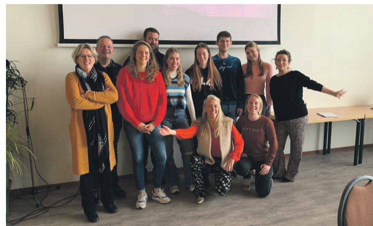
De dielnimmers oan de útwikseling nei Ierlân ta