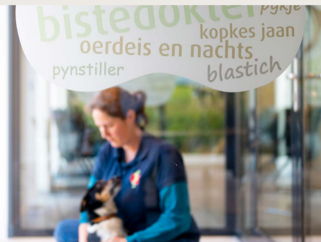
Frysk yn it nije pân fan de bistedokter yn Grou.