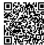
Foar € 3,50 te bestellen yn de Afûk websjop!

Yn it boekje stiet in ferhaaltsje oer Tomke dy't in dei wenne mei op skoalle en dêr wolkom hjitten wurdt troch de bern út de ferhaaltsjes fan Keimpe de Krokodil . Fynst yn it boekje ek spultsjes, in ferske en ynformaasje oer de meartalige ûntwikkeling. Der is romte foar de skoalle om in foto yn te plakken en foar de âlders om wat op te skriuwen oer harren bern. Sa wurdt it boekje in moai oantinken oan de earste perioade op de 'grutte skoalle'.