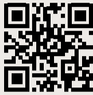
Nei de websjop